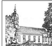
Pfarrei Mariä Himmelfahrt Seekirch

Ehrenamtliche Mitarbeiter von Radio Horeb Team Deutschland werden nach dem Gottesdienst eine kurze Information über den Sender geben und stehen Ihnen anschließend mit ihrem Infostand für Fragen und Information zur Verfügung.