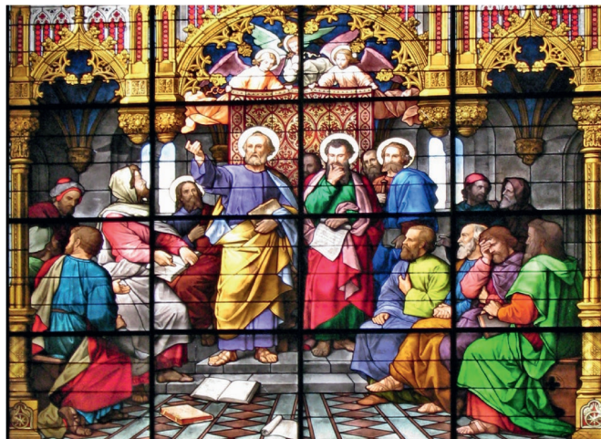
Bild: Apostelkonzil, Fenster im Kölner Dom

lassen müssten, um Christen zu werden. Die Ergebnisse sind festgehalten in der Apostelgeschichte (Apg 15,1-29) und im Brief des Paulus an die Galater (Gal 2,1-10): Eine Beschneidung war nicht mehr vonnöten, um Christ zu werden; vielmehr betonte Petrus, dass alle allein durch den Glauben gerettet werden. Die in der Apostelgeschichte genannten zu beachtenden Speisevorschriften nennt Paulus im Galaterbrief nicht und sie spielten offensichtlich auch keine große Rolle.