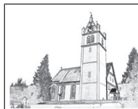
Pfarrei Johannes der Täufer Dürnai

Am Mittwoch, 05. November findet um 19.30 Uhr eine Sitzung des Kirchengemeinderates statt.