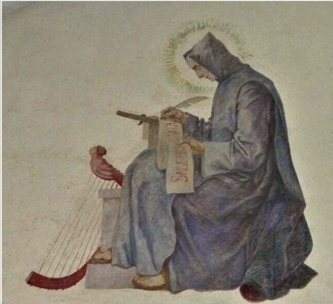
Bild: Hermann der Lahme, Kirche Kappel