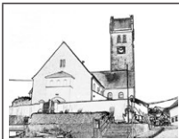
St. Peter- und Paulskirche, Kappel