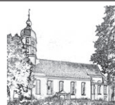
Pfarrei Mariä Himmelfahrt Seekirch

17.00 Uhr Martinsfeier mit Laternenumzug