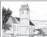
Pfarrei St. Clemens Betzenweiler

Am Dienstag, 04. November findet um 18.30 Uhr eine Sitzung des Kirchengemeinderates statt.