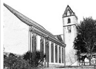
Stiftskirche St. Cornelius und Cyprianus, Bad Buchau

Gerne stehen wir vom Pastoralteam telefonisch für Sie bereit