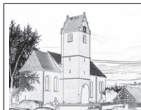
Pfarrei St. Clemens Betzenweiler