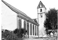
Stiftskirche St. Cornelius und Cyrianus, Bad Buchau

Gerne stehen wir vom Pastoralteam telefonisch für Sie bereit